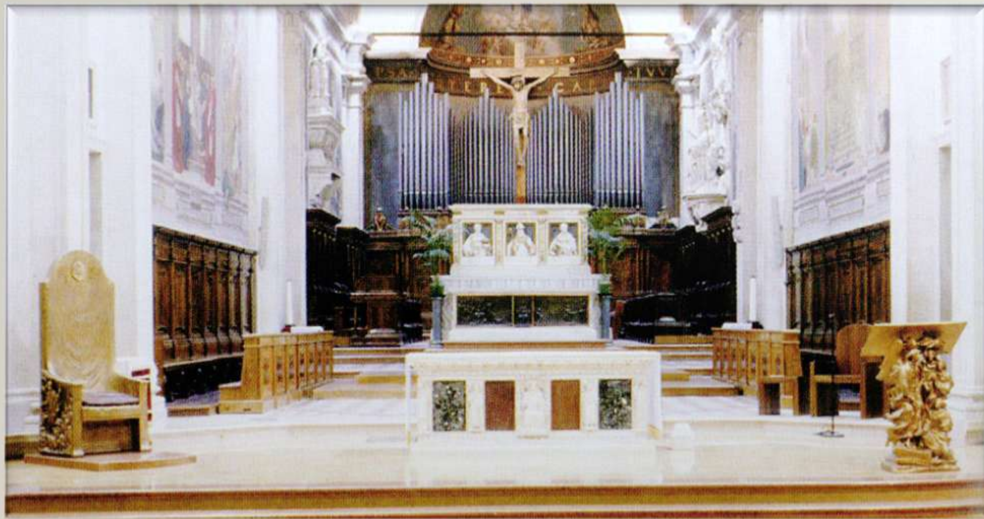
Catt di Treviso