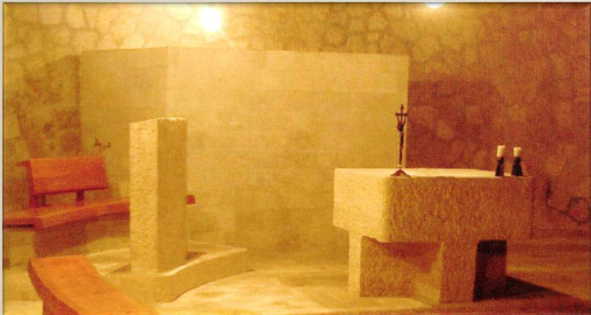
Cimitero di Valont